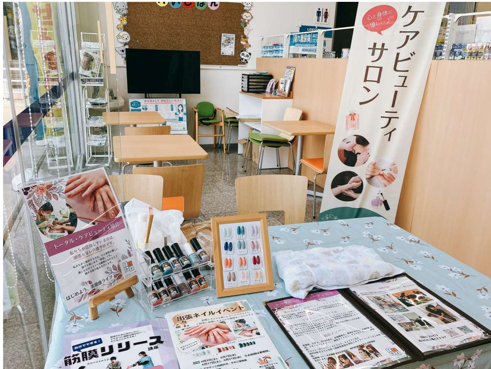
ウエルカフェを活用してのイベント