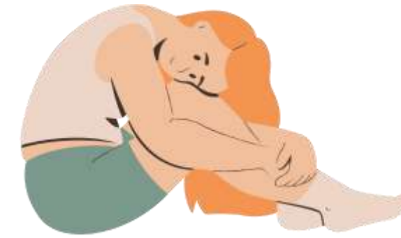
社会的な課題を 抱えている人 (引きこもりなど)