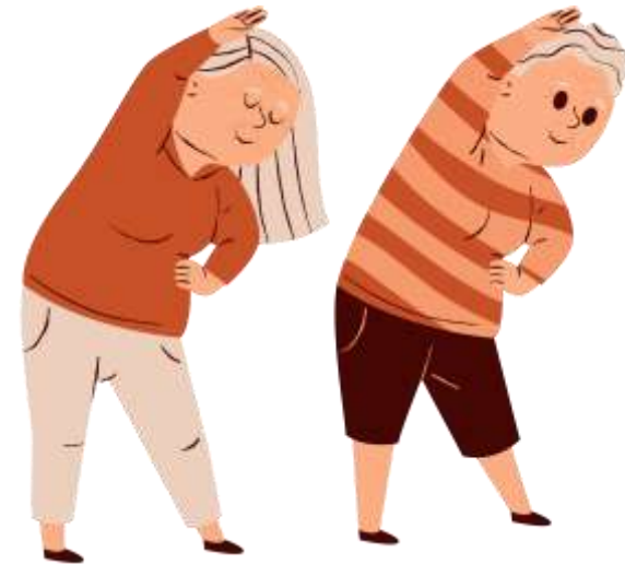
アクティブシニア